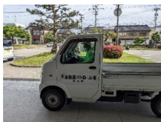
不法投棄パトロール車