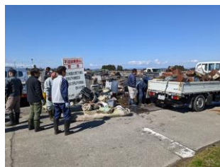
不法投棄物をトラックに積んだところ

3月19日(日曜日)、東大森地内において、地元住民により、不法投棄されたごみを回収し処分しました。廃屋跡地に家電、空き缶、タイヤなどが大量に投棄されており、隣接する農地に影響を及ぼしていました。本来なら、所有者が処分しなければならないところですが、地元住民が所有者の承諾を得て処分しました。