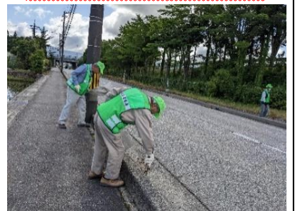
隙間のごみもよく見ます。