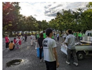
集合場所の皆さん (昨年の様子)

利田地区の常願寺川公園で、毎年恒例のクリーン作戦(清掃ボランティア)が開催されます。平成22年(2010年)の開催当初から、今年で14年目となります。7月の暑い時期ではございますが、涼しい早朝に行いますので気持ちがいいですよ。昨年は、リコージャパン(株)、(株)ロキテクノ、アイディック(株)の各企業の皆様も参加頂いております。当日、手袋・トンゴ・ゴミ袋を配布いたします。どなたでも、お気軽にご参加ください。