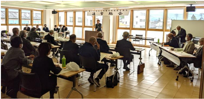
総会の様子（舟橋町長の祝辞）

4月24日、立山町元気交流ステーション2階会議室にて第16回通常総会を開催しました。令和4年度の収支報告・令和5年度の事業について承認されました。